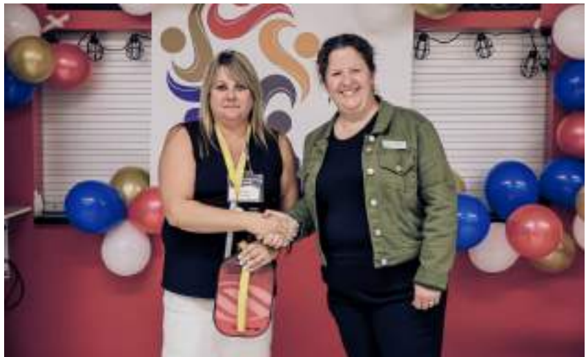
Pickleball amical AM