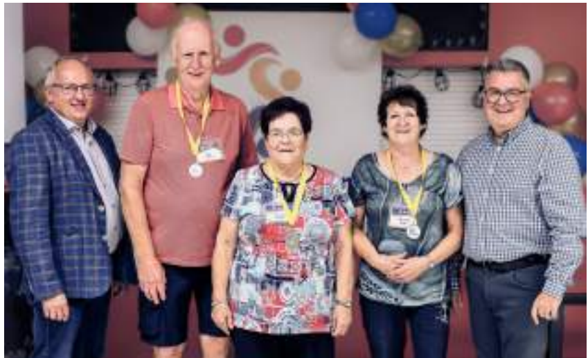
Pétanque extérieur PM