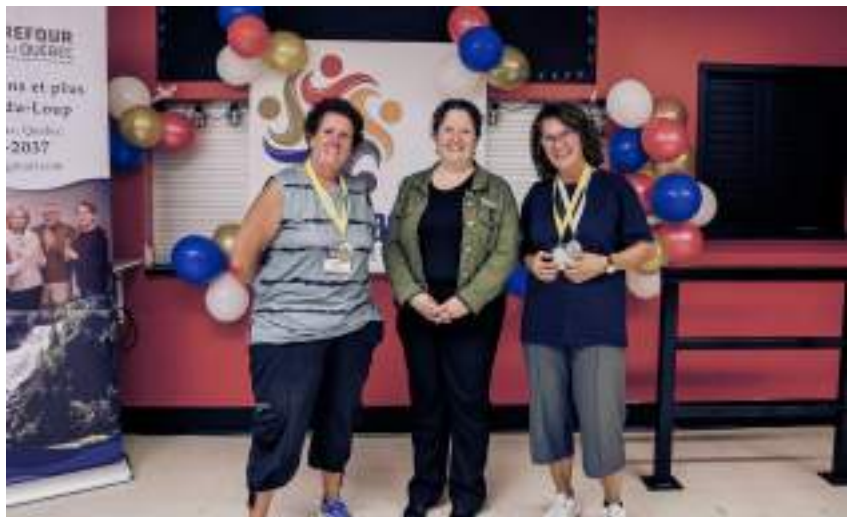
Pickleball amical PM